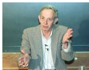
Il matematico americano John Nash, celebrato dal film «A beautiful mind»

I suoi deliri più ricorrenti riguardavano le visioni di messaggi criptati, provenienti anche da extraterrestri, il credere di essere l'imperatore dell'Antartide o il piede sinistro di Dio, l'essere a capo di un governo universale. John F. Nash Jr., 80 anni nel 2008, è considerato anche tra i matematici più brillanti e originali del '900. L'uomo che ha rivoluzionato l'economia con i suoi studi di matematica applicata alla «Teoria dei giochi», vincendo il premio Nobel per l'economia nel 1994. A lui il regista americano Ron Howard ha dedicato «A Beautiful Mind», con Russell Crowe, vincitore di ben quattro Oscar nel 2002. Il film ripercorre la sua personalissima odissea attraverso il tunnel della schizofrenia da cui Nash è miracolosamente guarito dopo circa 30 anni di terapie quali elettrochoc, camicie di forza e iniezioni d'insulina, che lo hanno segnato nel fisico ma non nella mente. Visto che oggi continua ad insegnare a Princeton, una delle università più prestigiose d'America.